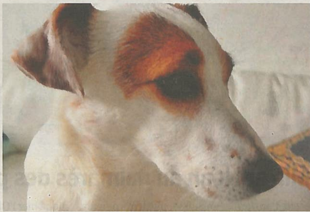
Snoopy avait disparu sur la côte neuchâteloise, entre Gorgier et Bevaix.

«Le problème est récurrent. Début août et fin décembre sont des périodes épouvantables pour les animaux», constate la Société de protection des animaux du Val-de-Travers (NE). Rien que dans cette région, cinq chiens et